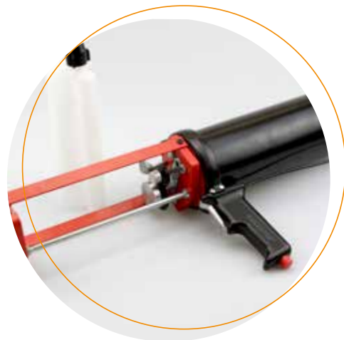
Köratool PP 204