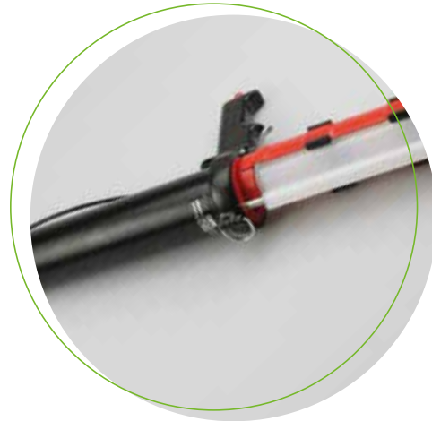
Köratool PP 205