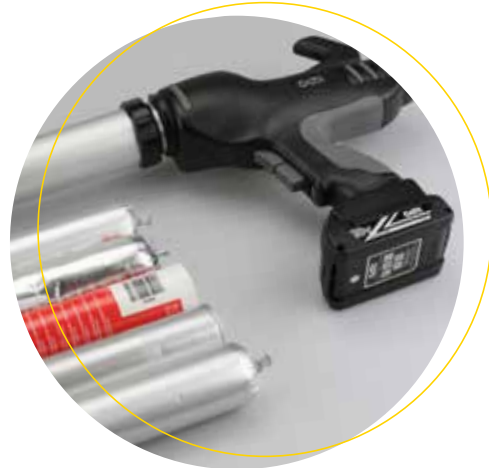
Köratool PA 101