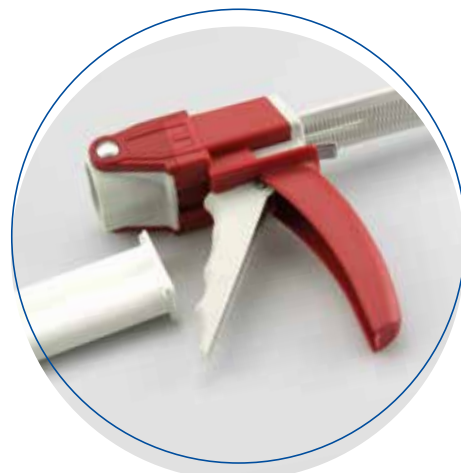
Köratool PM 202