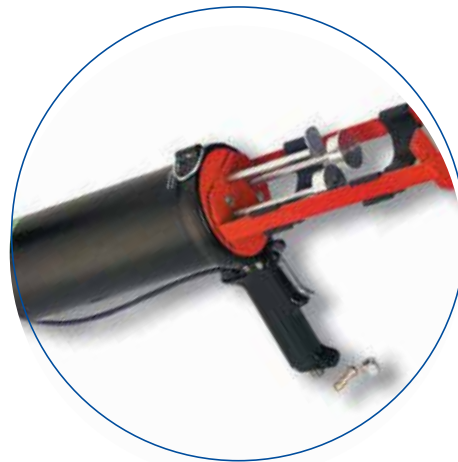
Köratool PP 206