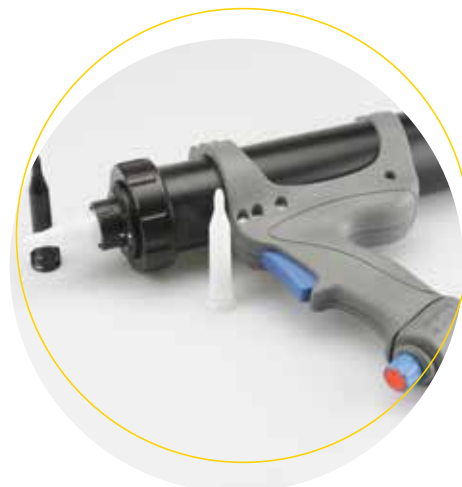
Köratool PP 103