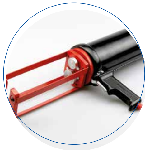
Köratool PP 203