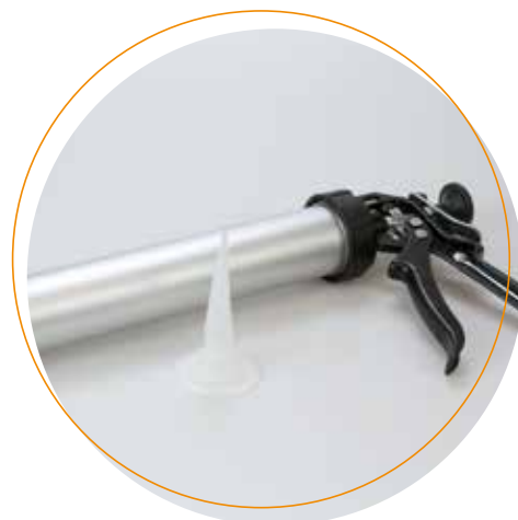
Köratool PM 101