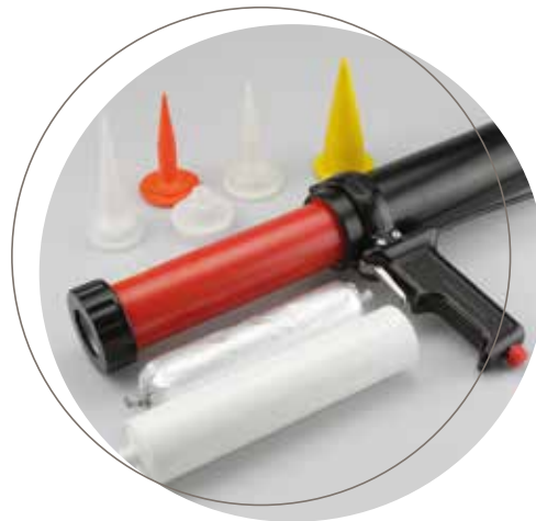
Köratool PP 102