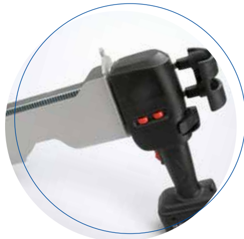
Köratool PA 201