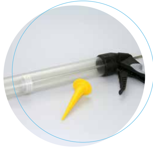
Köratool PM 102