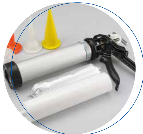
Köratool PM 104