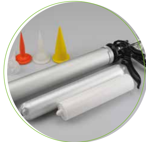
Köratool PM 103