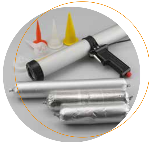
Köratool PP 101