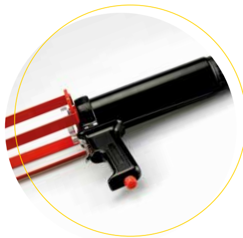
Köratool PP 201