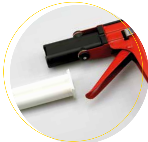
Köratool PM 201