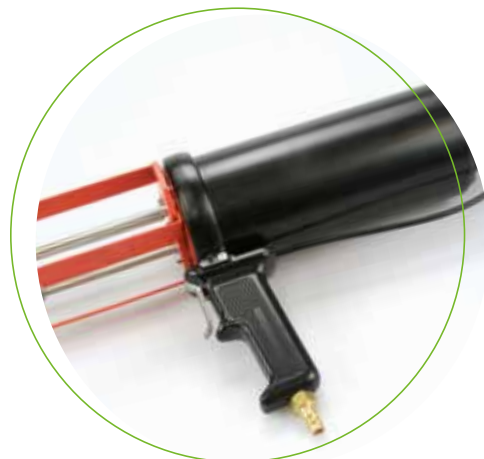
Köratool PP 202