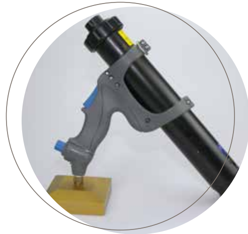
Köratool PP 104